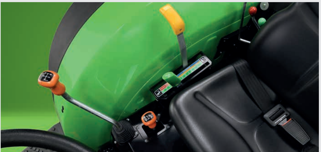
↑ Nauwkeurige mechanische hefinrichting achter met eenvoudige bediening.