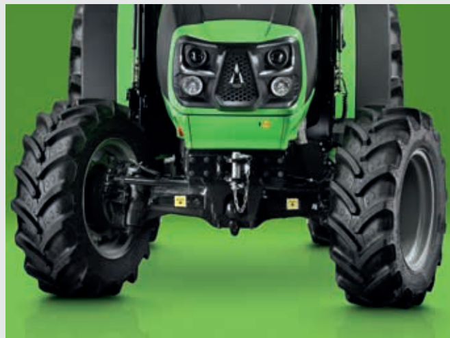
↑ Integraalremmen op 4 wielen dankzij de voorremmen.