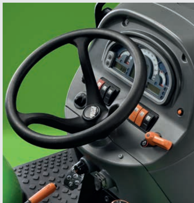
↑ Geheugen motortoerental. Sla een motortoerental op en roep het op met een druk op de knop.

EGR-circuit, een DOC-katalysator en een passief DPF-filter, waarvoor geen AdBlue of extra brandstof hoeft te worden gebruikt.