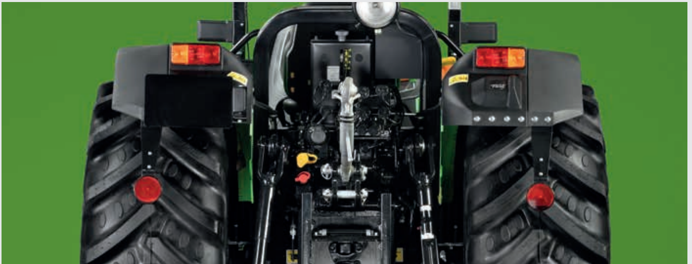
↑ Tot 3 mechanische regelkleppen achter.

Voor veilig transport en over de weg is een hydraulische DUAL-MODE-aanhangerrem als optie leverbaar.