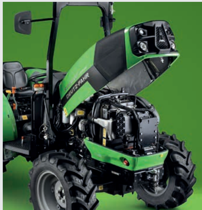
↑ Gemakkelijk te onderhouden dankzij de breed openende motorkap uit één stuk.

De 5DF Keyline-modellen zijn uitgerust met krachtige FARMotion 35-motoren met hoog koppel en turbo met intercooler. Het elektronisch gestuurde Common Rail-inspuitingssysteem - dat een druk van 2.000 bar kan bereiken - vormt samen met de viscostatische ventilator een indrukwekkend pakket van technologische oplossingen om de verbrandingsefficiëntie te optimaliseren voor maximale prestaties bij minimaal brandstofverbruik. Het nieuwe voorverwarmingssysteem zorgt voor een betrouwbare en snelle start van de motor, zelfs bij de laagste temperaturen. Net als op de modellen met een hoger vermogen in het assortiment van DEUTZ-FAHR, bedraagt het maximumtoerental slechts 2200 omw/min, terwijl het 80-model een koppelreserve van 28% heeft. De emissievoorschriften van Stage V worden nageleefd dankzij een gecombineerd nabehandelingsysteem met een extern gekoeld